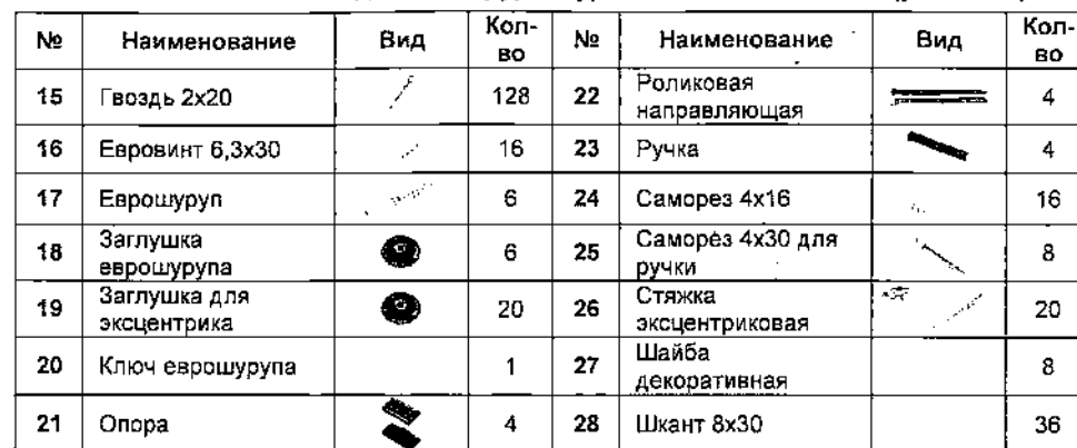
Схема сборки. Комод Коста-Рика