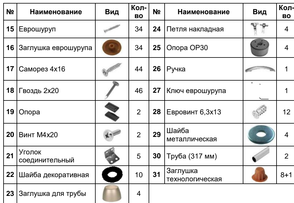
Схема сборки. Стол компьютерный Юниор